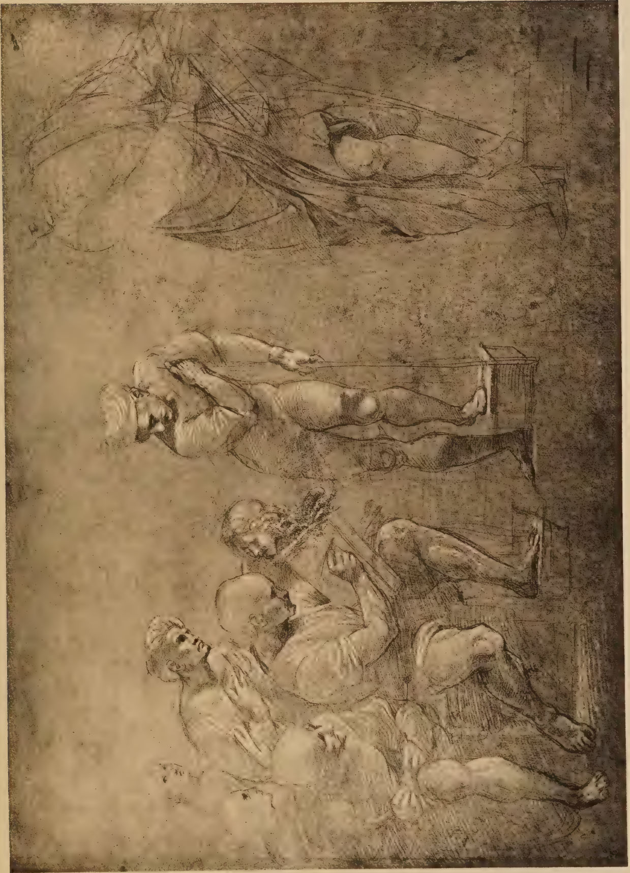
Etude pour le groupe de gauche de l'Ecole d'Athènes